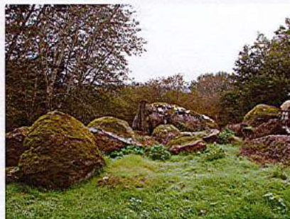
Chaos granitique à la Chapelle d'Ouhant

Un massif granitique est parcouru de fissures qui le divisent en gros blocs. L'eau s'infiltré dans les fissures, entraînant la transformation de certains constituants du granite. Plus meubles, voire dissous, ils sont emportés par l'eau. Progressivement, les fissures s'élargissent. Au fil du temps, le travail de l'eau dégage les blocs qui n'ont donc rien à voir avec des moraines d'anciens glaciers comme on l'entend dire parfois, mais qui se sont formés sur place.